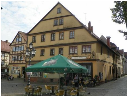
eindrucksvollen untergebracht ist. Dreisbusch Stock des Vorgängerbaus des

Das größte Gebäude am Platz bildet das Bistro Hanoi mit dem bekannten „Keiler Bier“. Fachwerk vom feinsten findet sich durch das „Franz Dreisbusch Haus“. Der Name verbindet einen Juwelier mit einem Optikermeister.