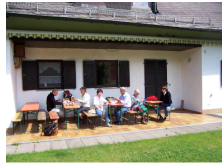
Wanderheim in Rothleiten

Am Jugend- und Wanderheim des Frankenwaldverein gönnen uns unsere erste Pause. Ich habe gestern bei meiner Vorwanderung noch mehrere Helfer bei der Erneuerung des Treppengeländes der Kinderrutschröhre angetroffen. Das Wanderheim ist heute leider nicht bewirtet.