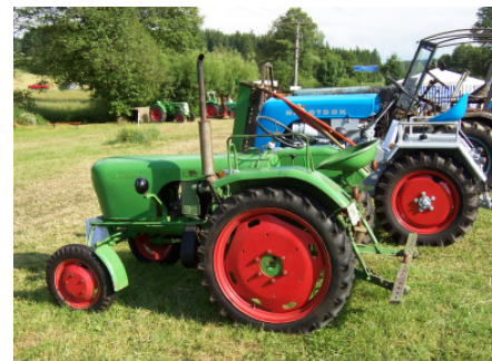
Oldtimertreff in Reitzenstein