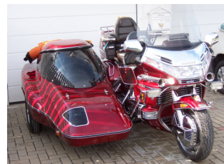
Honda mit Beiwagen

Dieses aufpolierte Honda Modell glitzert auf einem Parkplatz in Reitzenstein.