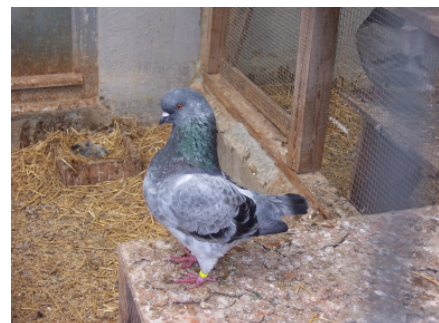
Eine Kanada - Taube

Wir treffen einen Züchter dieser schönen Exemplare kanadischer Tauben beim Füttern an.