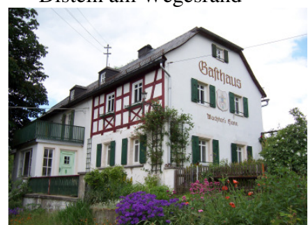
Gasthaus in Griesbach

Schade, dass dieses Idyll zur Einkehr nicht mehr zur Verfügung steht. Diese ehemalige Gaststätte mit Biergarten unter einem Kastanienbaum sticht dem Wanderer etwas abseits vom FGW in Griesbach ins Auge.