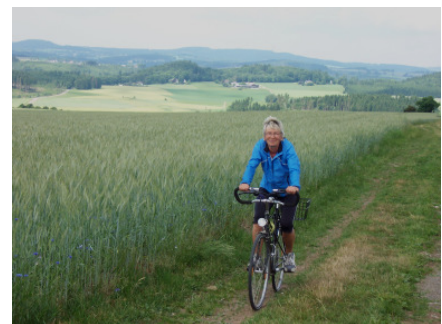
Radlerin am FGW

Dieser Streckenabschnitt lädt nicht nur zum Wandern, sondern auch zum Radfahren ein. Der Frankenwaldverein hat eine Menge an Wander- und Radfahrwegen ausgezeichnet. Einen „Brotzeitweg“, einen „Ozänderweg“ oder einen „Schwammaweg“, stellt der Frankenwaldverein Spaziergängern und Wanderern zur Verfügung.