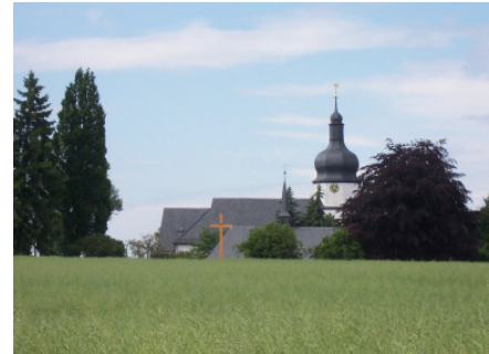
„Berg“ in Bayern ganz oben

Die Sonne zeigt wieder ihr Gesicht und die Kirche von Berg erscheint vor uns in einer Mulde.