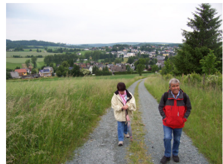
Blick zurück auf Issigau

Der erste Kilometer führt steil bergan auf den Kapp. Wir werden mit einem Rundumblick auf den Döbraberg (794 m üNN) und auf unsere letzte Wanderetappe belohnt.