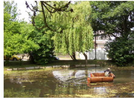
Sautrogrennen in Rodesgrün

Kurz nach Mittag erreichen wir die Ortschaft Rodesgrün. Am Kirchweihsonntag findet alljährlich das „Sautrogrennen“ statt. Nach einer Einkehr im Gasthaus treten wir wieder unseren Rückweg an. Wir haben den südlichsten Punkt unserer Wanderetappe erreicht und schlagen den „Brotzeitweg“ über Neuhaus nach Reitzenstein ein.