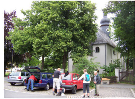
Ausgangspunkt in Issigau