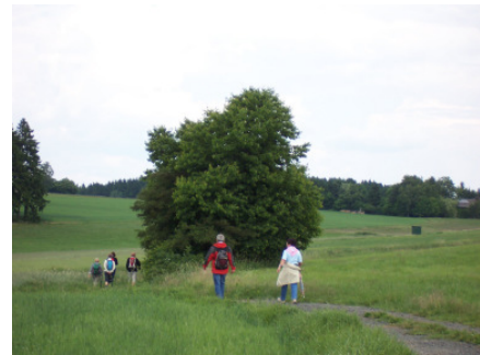
Weg nach Neuhaus

Bis jetzt hat das Wetter gehalten, trotz starken dunklen Wolken.