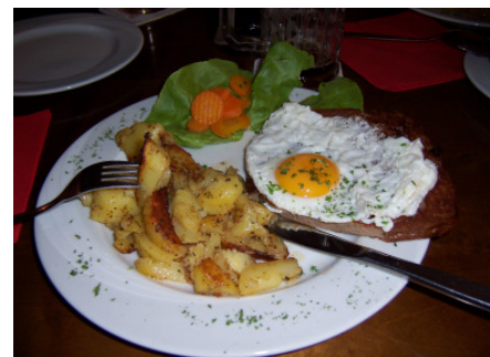
Leberkäse mit Ei

Freundlichkeit bei gemütlicher Atmosphäre in der „Schlossschenke“ in Issigau.