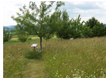
Lehrpfad der Streuobstwiesen

Schmale Gänge sind in die Wiesen gemäht und unzählige Tafeln machen auf die verschiedenen Obstsorten der Streuobstwiesen aufmerksam.